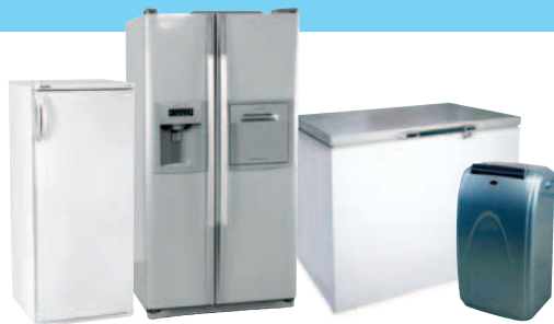
RÉFRIGÉRATEURS / CONGÉLATEURS / CLIMATISEURS