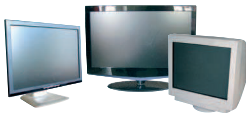
TÉLÉVISEURS / MONITEURS