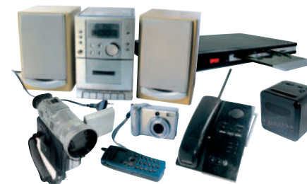
AUDIO / VIDÉO / TÉLÉPHONIE