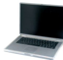
ORDINATEURS PORTABLES / ÉCRANS