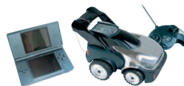
JOUETS / LOISIRS