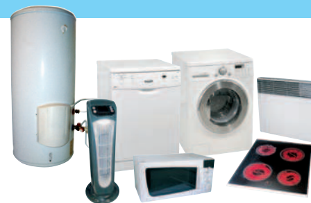
LAVAGE / CUISSON / CHAUFFAGE